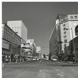
「大宮駅」東口からみた風景