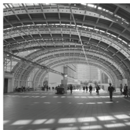
「さいたま新都心駅」コンコース

「さいたま国際芸術祭2023」へのアクセスには、「さいたま新都心駅」と「大宮駅」の2つの選択肢がある。どちらの駅もメイン会場まではほぼ同距離。