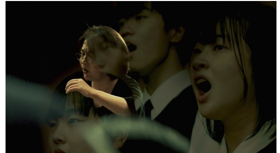
ミハイル・カリキス《ラスト・コンサート》(2023)

メイン会場では、芸術祭テーマと親和性の深い様々な作品を紹介。現代アーティスト、写真家、盆栽師、研究者など、国際的に活躍するアーティストや、新進気鋭の多様なアーティストたちが、独自の視点から「わたしたち」の存在の根源に迫る作品を発表する。