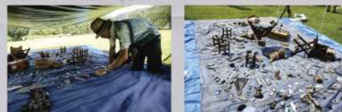
『現在の青図ー Shadow of Lives -2017ー』制作風景