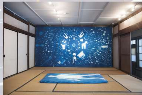
『現在の青図ー Shadow of Lives -2017ー』 2017年制作 450cm×235cm Cyanotype 中之条ビエンナーレ 2017 伊参スタジオ

会場の STUDIO・45 は、約35年営まれたまちの写真撮影スタジオ。その空間を生かし、来た人がホッと、落ち着ける場所、人と人が繋がる空間作りを目指して様々なプロジェクトを行っています。今回は、STUDIO・45 を「さいたま de 海賊」のアジトと見立て、プロジェクト参加者の「たからもの」の宝物庫のイメージで皆様をお迎えします。どうぞ、お気軽にご来場ください。